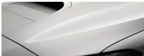
Белый перламутр (Crystal White Pearl)