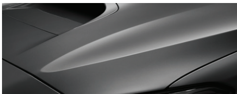
Темно-серый металлик (Magnetite Gray Metallic)