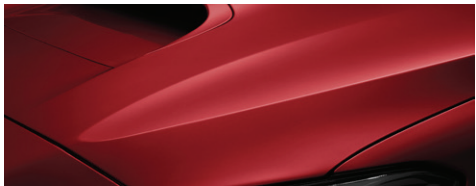
Красный (Pure Red)