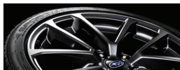
18" легкосплавные диски