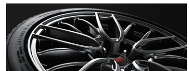
18" легкосплавные диски STI