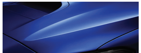
Синий перламутр Rally (WR Blue Pearl)